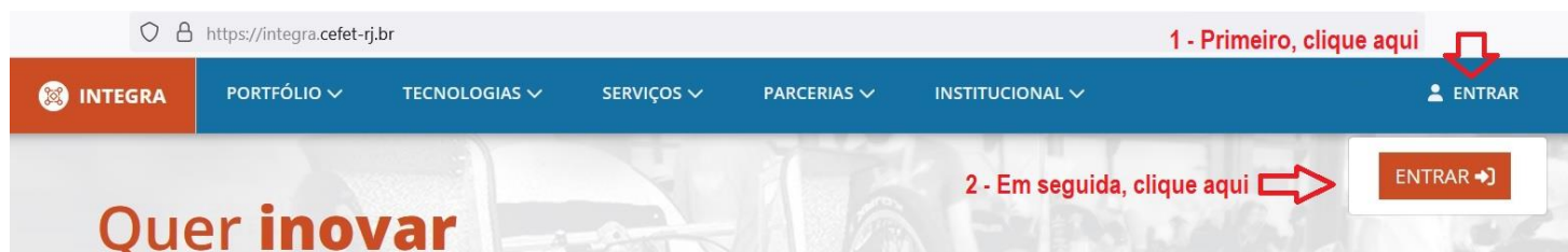
Figura 1: Acesso ao Portal Integra.

2 – Clique na opção ENTRAR, no canto superior direito da página e, em seguida, clique no botão ENTRAR que irá aparecer (Figura 1).