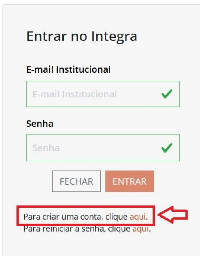
Figura 2: Opção de criar uma conta.

3 – Clique na opção “Para criar uma conta, clique aqui” (Figura 2).