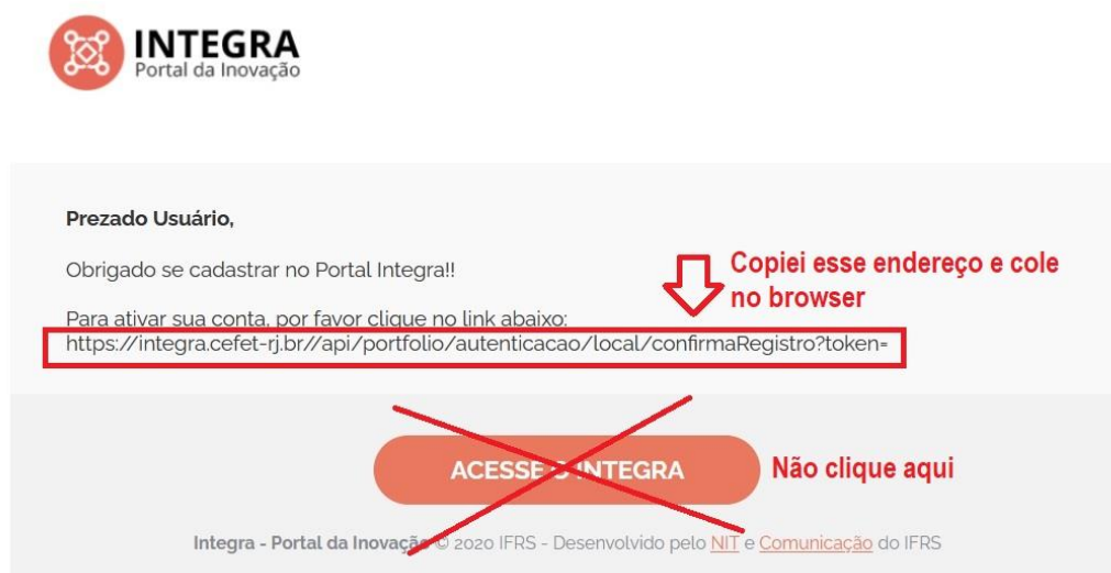
Figura 4: E-mail enviado para validar a conta criado no Portal Integra.

[Portal Integra] Estamos quase lá! Por favor, confirme para acessar o Portal Integra